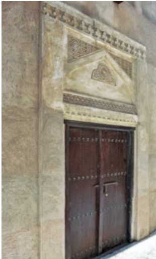
زخارف جصية محفورة