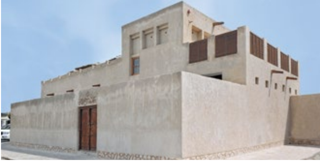
مدخل البيت لا يبرز عن مستوى الواجهة