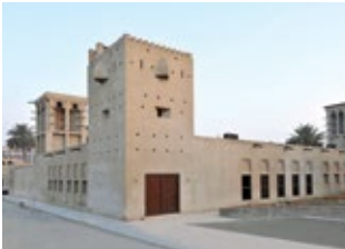
المدخل على جانب الواجهة

يختلف مكان المدخل بالنسبة للواجهة، فقد يتوسط المدخل الواجهة، أو يكون على جانبها، وغالبا ما تكون نوافذ المجلس بجوار المدخل.