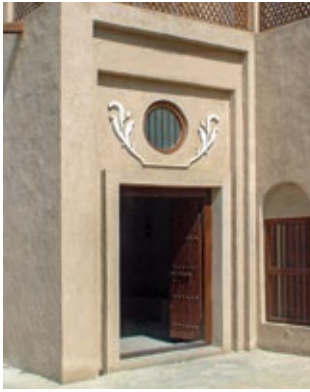
زخارف جصية بارزة

زينت الزخارف بأنواعها المختلفة مداخل البيوت، ومثلت هذه الزخارف انعكاسا للمكانة الاجتماعية لصاحب البيت، ومن أنواع الزخارف الحليات الركنية، والزخارف الجصية البارزة التي توجد أعلى باب المدخل، والزخارف الفحمية، والزخارف التجويفية، والزخارف المحفورة.