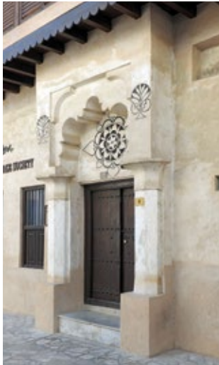
زخارف جصية فحمية وتجويفية