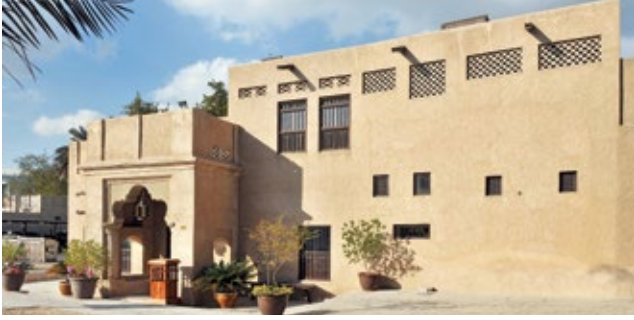
مدخل بارز به قوس أعلى عمودي المدخل

بعض المداخل تكون بارزة عن واجهة المبنى، وغالبا ما يتصدرها عمودان يحيطان بالمدخل ويؤكدانه، يعلوهما قوس أو زخارف ركنية، تؤكد في مجملها الصورة البصرية للمدخل، وقد يكون المدخل في نفس مستوى واجهة البيت وغير بارز عنها.