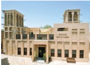
المدخل يتوسط الواجهة

مدخل البيت هو نقطة الاتصال والانفصال بين فراغات البيت والمحيط الخارجي، ويمثل عنصرا من عناصر حفظ أمن البيوت وخصوصيتها، وكذلك الترحاب بالضيوف، وتعتبر مداخل البيوت في عمارة دبي التقليدية من الأمثلة الواضحة على قدرة العمارة على تفهم احتياجات سكان البيت ومواءمة الظروف الاجتماعية والعادات والتقاليد.