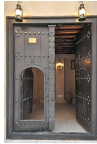
الباب الصغير "الفرخة"